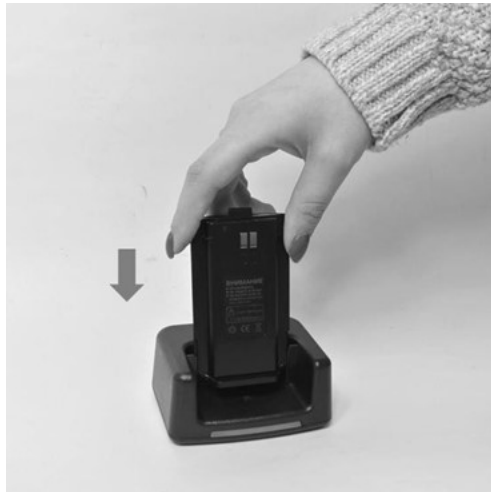
Рис. 7. Установка аккумуляторной батареи на зарядную базу.

Если вы приобрели сменную аккумуляторную батарею, её можно заряжать в то время, как радиостанция с батареей из комплекта находится в работе. Совместите направляющие на боковых стенках батареи с направляющими в слоте зарядной базы и установите батарею.