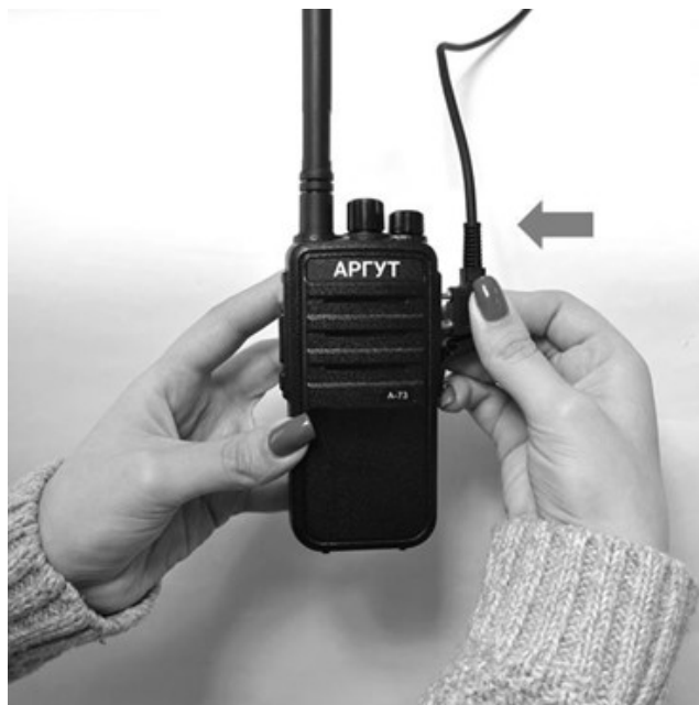
Рис. 8. Подключение гарнитуры.

В режиме передачи радиостанция потребляет значительный ток, разряжающий аккумуляторную батарею. Чтобы продлить время работы радиостанции, сокращайте время вызова и передачи. Проводите радиообмен чётко сформулированными и однозначными сообщениями, короткими командами, условными кодами.