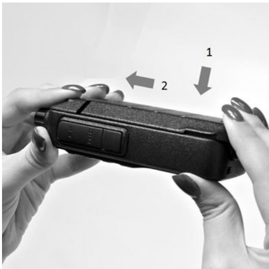
Рис. 2. Установка аккумуляторной батареи.

Совместите направляющие на аккумуляторной батарее с направляющими на шасси радиостанции. Прижмите батарею к шасси и сдвиньте влево до щелчка.