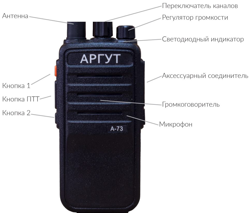
Рис. 1. Расположение органов управления, индикации и соединителей.

Радиостанция выполнена на металлическом шасси, в корпусе из ударопрочного пластика. Органы управления и индикации расположены на верхней и левой панелях корпуса. Соединитель антенны — на верхней панели. Соединитель подключения гарнитуры и кабеля программирования (аксессуарный соединитель) — на правой панели. Клеммы для присоединения к зарядной базе — на задней стенке аккумуляторной батареи.