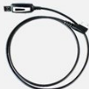
Кабель для программирования