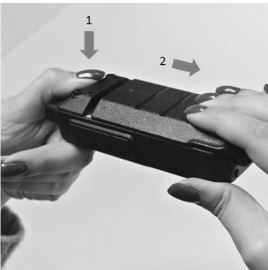
Рис. 3. Снятие аккумуляторной батареи.

Для снятия аккумуляторной батареи нажмите на фиксатор и сдвиньте батарею вправо, как показано на рисунке 3.