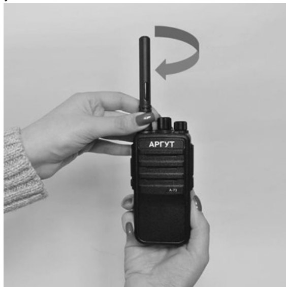
Рис. 4. Присоединение антенны.