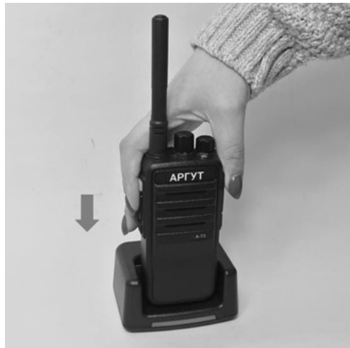
Рис. 6. Установка радиостанции на зарядную базу.

Перед использованием радиостанции зарядите аккумуляторную батарею. Подключите соединитель адаптера питания к зарядной базе. Вставьте вилку адаптера питания в розетку сети переменного тока 220 В, 50 Гц. Светодиодный индикатор на зарядной базе в ожидании зарядки будет гореть зелёным. Установите радиостанцию с присоединённой аккумуляторной батареей на зарядную базу. Светодиодный индикатор на зарядной базе загорится красным. По окончании зарядки индикатор сменит цвет на зелёный — снимите радиостанцию с зарядной базы.