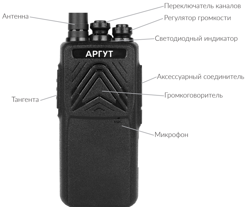
Рис. 1. Расположение органов управления, индикации и соединителей.

На задней стенке аккумуляторной батареи — отверстия с резьбой для крепления клипсы с помощью винтов из комплекта. В нижней части радиостанции — фиксатор аккумуляторной батареи.