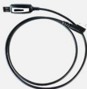
Кабель для программирования