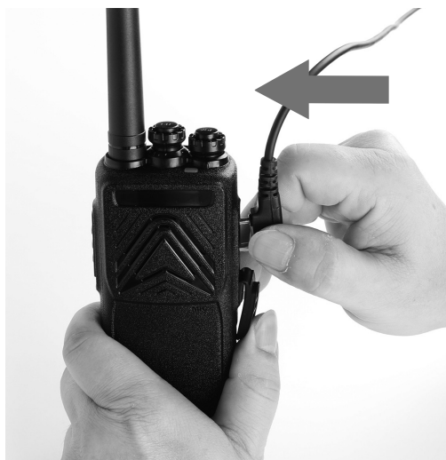
Рис. 8. Подключение гарнитуры.

Если вы приобрели гарнитуру и планируете её использовать, подключите её к радиостанции. Для этого отведите в сторону защитную крышку и подключите гарнитуру к аксессуарному соединителю.