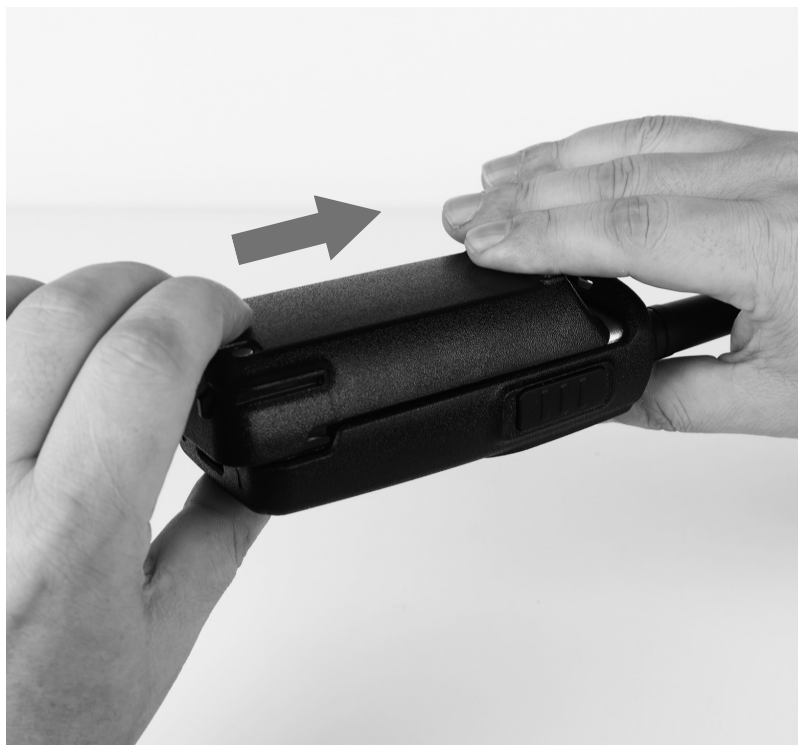
Рис. 2. Установка аккумуляторной батареи.

Совместите направляющие на аккумуляторной батарее с направляющими на шасси радиостанции. Прижмите батарею к шасси и сдвиньте влево до щелчка.