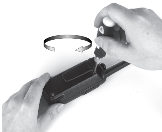
Рис. 5. Присоединение клипсы для крепления.

Если вы планируете носить радиостанцию на поясном ремне или крепить к одежде, присоедините клипсу. Совместите крепёжные отверстия клипсы с отверстиями на задней панели радиостанции и закрепите клипсу с помощью винтов из комплекта. Используйте крестовую отвёртку.