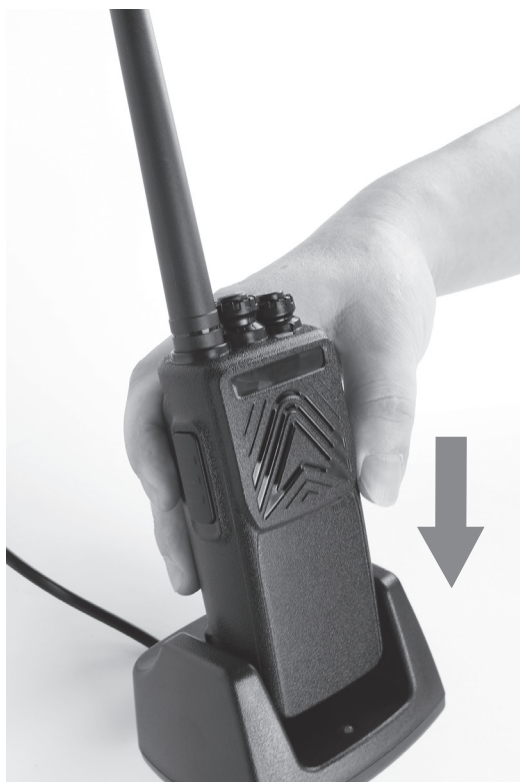
Рис. 6. Установка радиостанции на зарядку.

Установите радиостанцию с присоединённой аккумуляторной батареей в слот зарядного устройства. Светодиодный индикатор на зарядном устройстве загорится красным. По окончании зарядки индикатор сменит цвет на зелёный — снимите радиостанцию с зарядки.