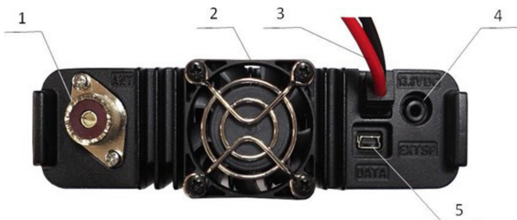
Рис. 2. Расположение соединителей на задней панели

Крыльчатка вентилятора, охлаждающего радиатор выходного каскада передатчика, защищена решёткой от попадания посторонних предметов.