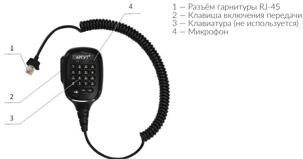
Рис. 3. Расположение органов управления и соединителя гарнитуры